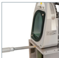
Präzises Justieren der Einstellschablone.