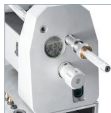
Den Handgriff drehen, um die Elektrode zu kürzen.