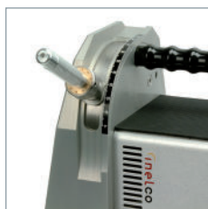
Schleifen der Elektrode im gewünschten Winkel.