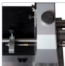
Einstellen der Kürzungslänge.